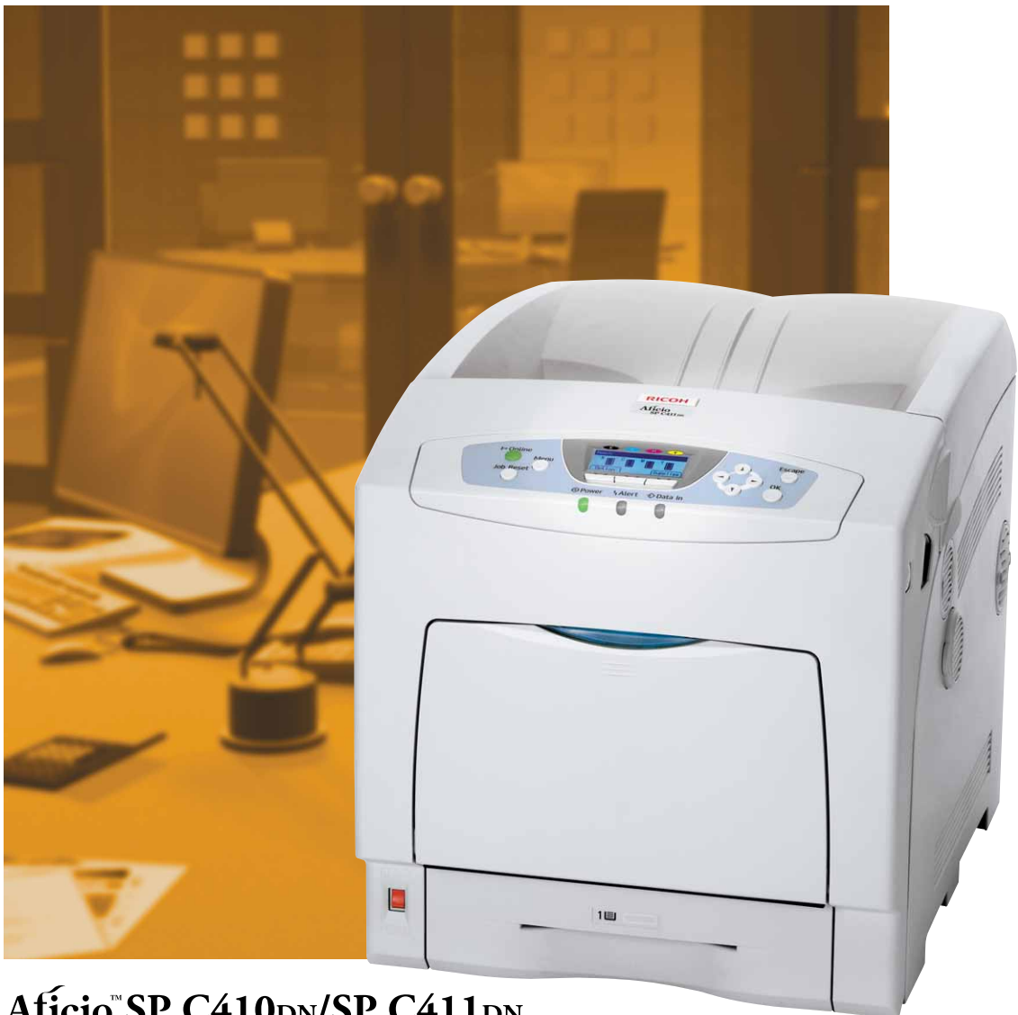
Aficio™ SP C410DN/SP C411DN

Alta qualità e grande convenienza nella stampa a colori